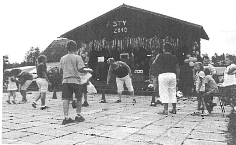
Fotografia nr 2. Festyn w miejscowości Pogobie Średnie