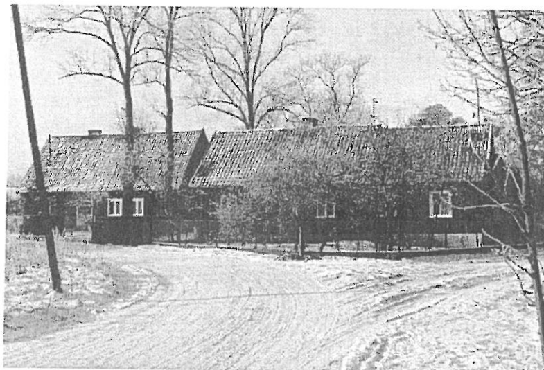
Fotografia nr 1. Fragment głównej ulicy wsi