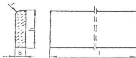
Rysunek 1. Kształt betonowego obrzeża chodnikowego

Kształt obrzeży betonowych przedstawiono na rysunku 1, a wymiary podano w tablicy 1.