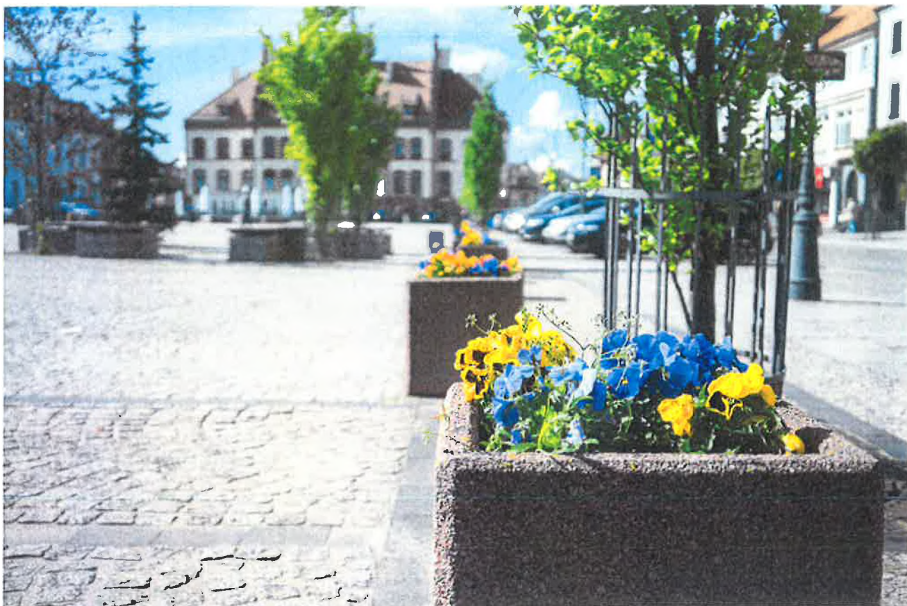
— DSC03897.jpg —