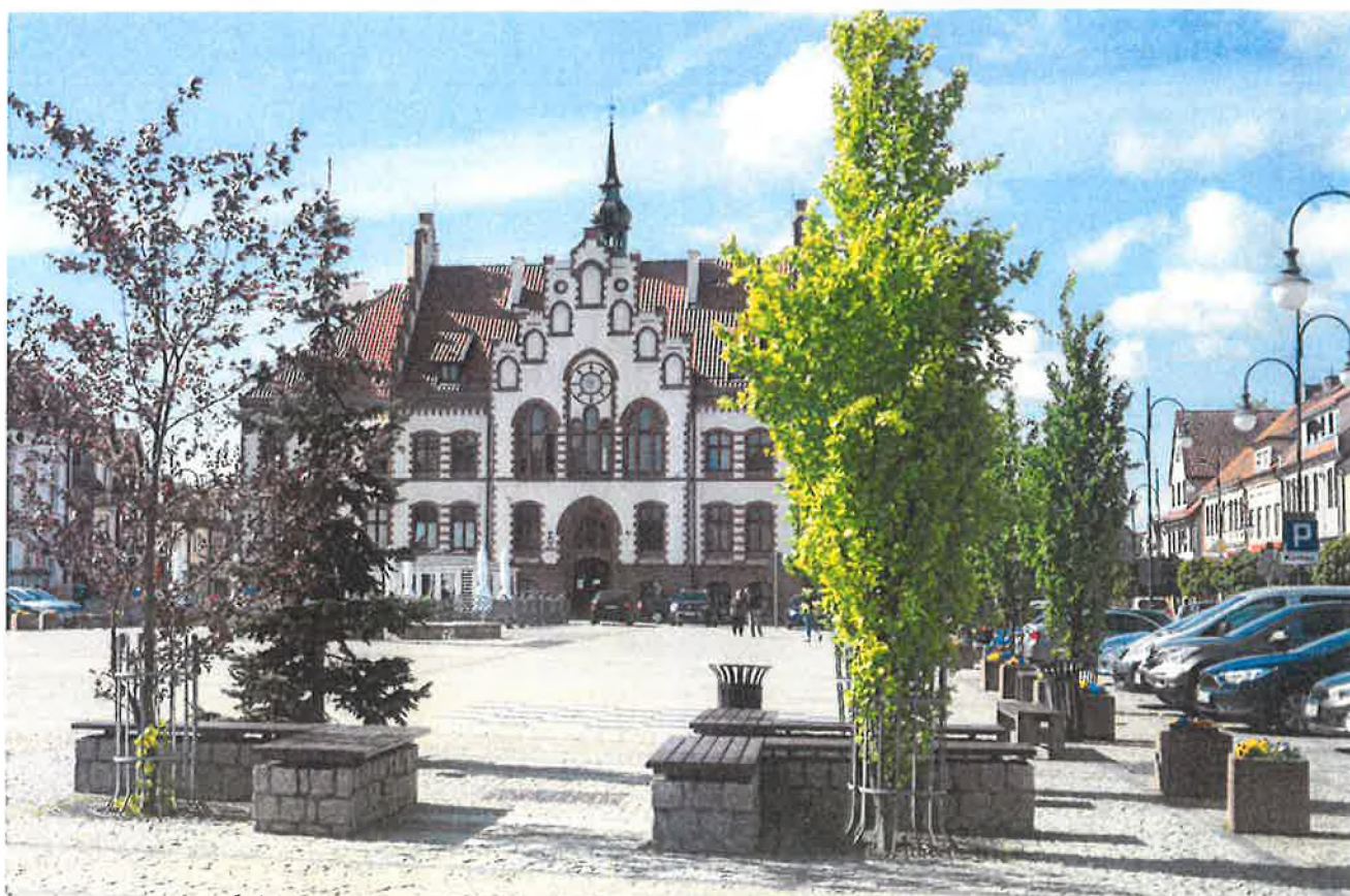
— DSC03900.jpg —