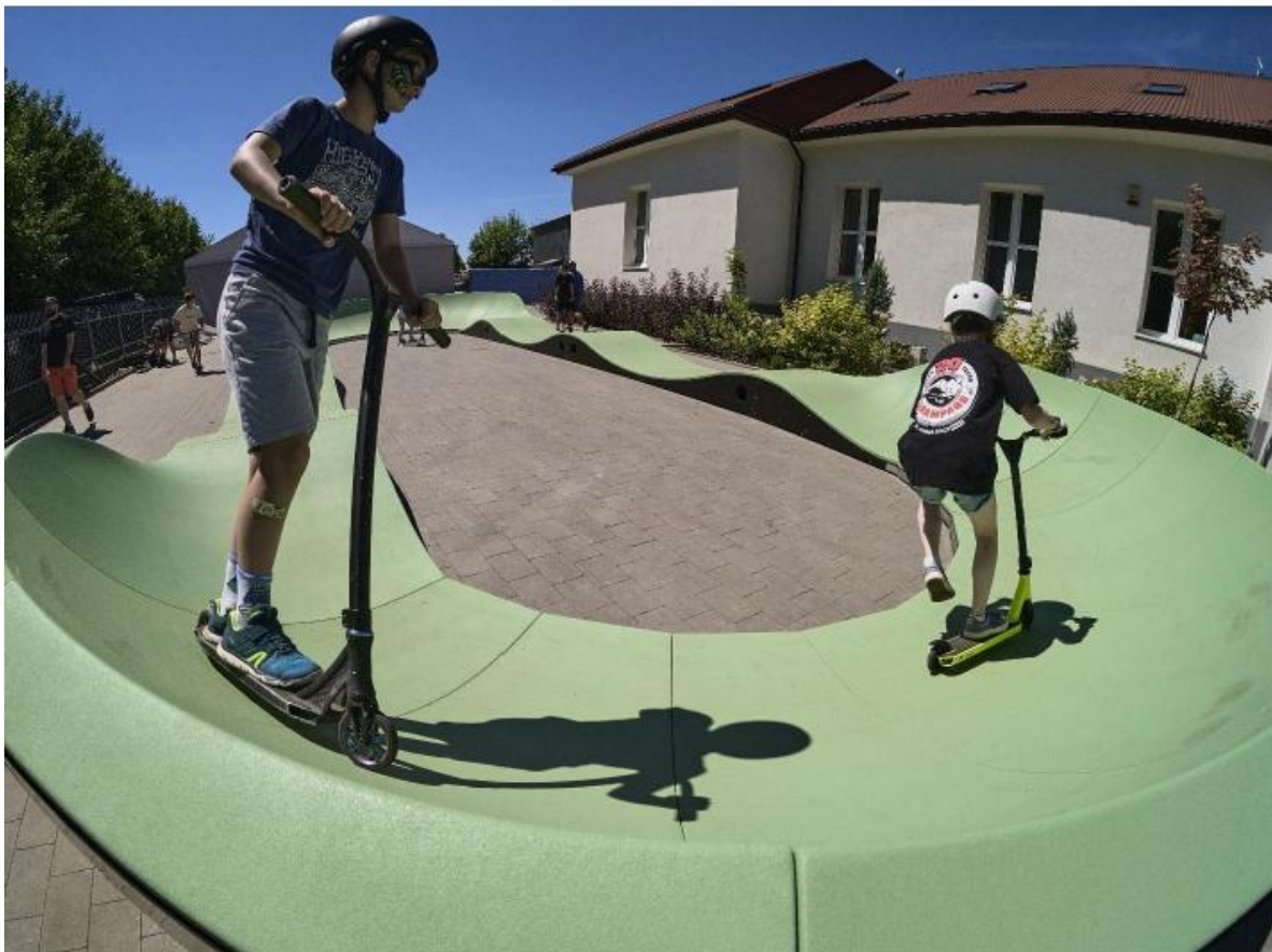
Tor rowerowy (skate ścieżka, pumtrack) – 1 kpl.