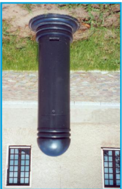
Słupsk zaopatrzony ( poboru energii ) typu TVP-3000 f-my "TRAPP-GmbH" Sp. z o.o.