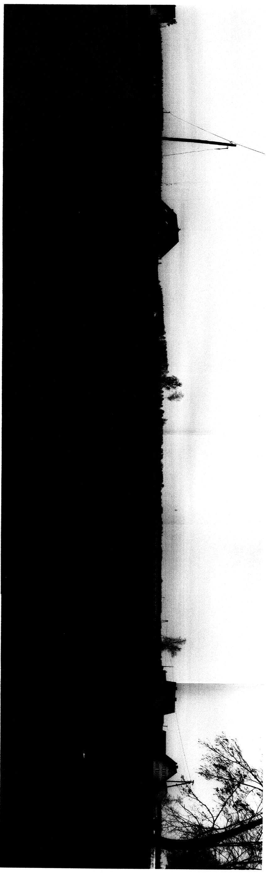
Zdjęcie 1. Tereny przy drodze krajowej nr 58 (południowa granica opracowania)