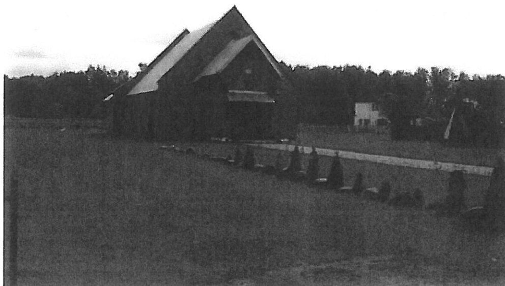
Fotografia nr 4. Cmentarz w Karwiku